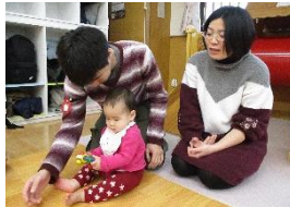
お父さんも参加です。いつでも遊びに来てくださいね。