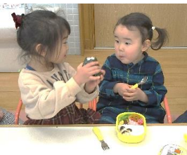
つくしっこでランチタイム。みんなで食卓を囲んで食べる体験は大切です。

H30年度つくしっこ広場について、利用者の皆様よりご意見をいただきました。紹介します。(抜粋)