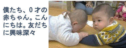
僕たち、0才の赤ちゃん。こんには。友だちに興味深々