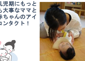
乳児期にもっとも大事なママと赤ちゃんのアイコンタクト!

他県から引っ越ししてきたのでわからないことだらけでしたがいろんな情報が得られ、それが1番良かったです。