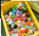
このポンポンを転がします。