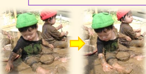
Sくんは、水たまりの中に手を入れてバシャバシャと水面を叩き、水しぶきを上げて遊んでいました。保育教諭が「バシャバシャ」というと、水面を叩く力が徐々に強くなっていき、泥水が跳ねるのを楽しみ、全身で泥んこ遊びを満喫していました。