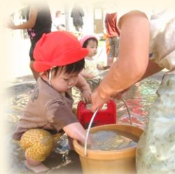
泥水の入ったバケツを見つけると、手を突っ込んでグルグルと手を入れると、豪快に混ぜていましたよ。