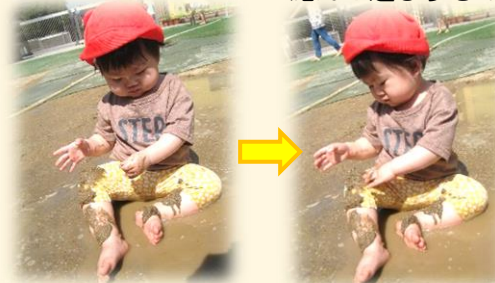
Sちゃんは泥を触り、手でつまんで自分の足に乗せていました。

水遊びをした次の日、アジサイ広場の前の土が、ぬるっとした水を含んだ泥になっていました。泥んこ遊びするのに、ちょうど良いと思い、少し水を流して水たまりを作って遊びました。