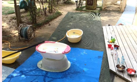
子どもの水遊びの様子