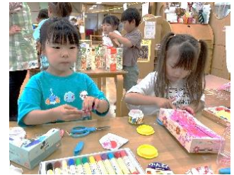
ちょきちょき、ペタペタ♪