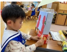
ロボット作りたい!