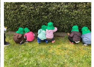
虫探しに夢中な後ろ姿、とても可愛いです♡

虫を触れなかった子は、お友だちや保育教諭が触っているのをじっと見ていました。触ってみようかなと思ったようで、指先でツツツ。そしていつの間にか、躊躇なく触れるようになっていました。