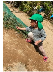
アリさんまてまて