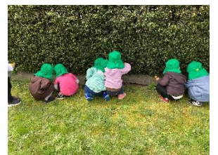
虫探しに夢中な後ろ姿、とても可愛いです♡

虫を触れなかった子は、お友だちや保育教諭が触っているのをじっと見ていました。触ってみようかなと思ったようで、指先でツツツ。そしていつの間にか、躊躇なく触れるようになっていました。