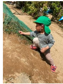
アリさんまてまて