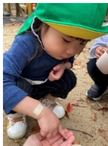
ダンゴムシおったよ