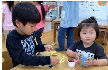
ジュースとアイス 美味しいな★

年長さんの保育室では、アイス屋さんとジュース屋さん、ラーメン屋さんがオープンしていました。子どもたちは年長さんに手作りのお金をもらい、自分の好きな物を買いにきました。自分で選んで買ったものを、トレーに乗せてもらい、飲食コーナーで友だちや、お兄ちゃん、お姉ちゃんと一緒に食べる真似をして、ゆったりと休憩していましたよ♪