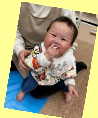
おやつ時間☆ミルクを飲んだりおせんべいを食べたりしています。 おいしくてついニコニコになっちゃいます♡