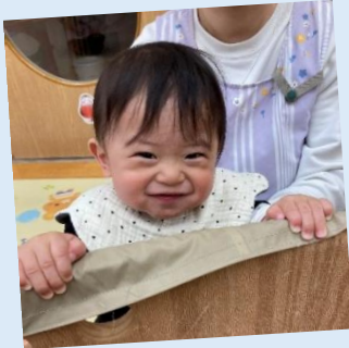
声をかけると ニコッと笑顔に☆