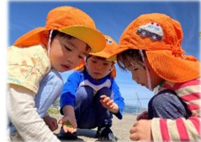
サイエンスヒルズにて、だんごむしを発見！友達と真剣に観察しています。