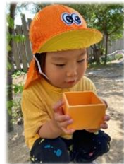
「だんごむし、壁登ったよ」

散歩へ行きやすい季節になった為、天気の良い日は戸外へ出掛け、自然に触れる中で子ども達の興味や発見を保育者も一緒に喜び、楽しんでいきたいです。