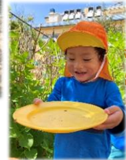
「だんごむし可愛いね〜」