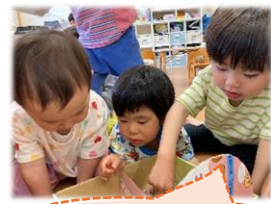
だんごむし迷路にだんごむしを入れて観察しています。「壁登った！落ちるよー！」